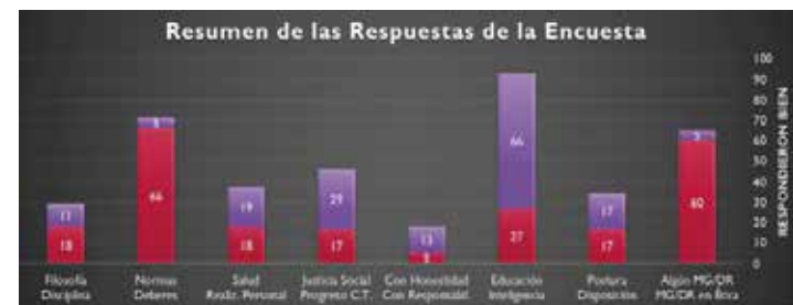
Gráfico 1. Ética y valores en estudiantes de medicina huamana - UNSLG

Las respuestas a la encuesta nos muestran: que definen a la ética como filosofía 11 (10%) y como disciplina 18 (16%); a la Deontología: la definen como deberes 66 (60 %), normas 5 (4.6%); a la pregunta de identificar a lo más importante en la vida, señalan: a la realización personal 18 (16.5%) y a la salud 19 (17%); a la pregunta qué desearía para el mundo: la justicia social 29 (26.6%) y el progreso 17 (15.6%); a la pregunta cómo debe comportarse ante otras personas: con responsabilidad 5 (4.6%) y con honestidad 13 (11.9%); a la pregunta: que es lo indispensable para competir en la vida: señalan a la educación 66 (60%) y a la inteligencia 27 (24.8%). Definen a la actitud como disposición 17 (15.6%) y como postura 17 (15.6%), señalan que las actitudes prioritarias en la enseñanza aprendizaje son: la motivación 99 (90%), la atención 51 (47%), la disposición al cambio 37 (34%), y a la receptividad 28 (26.6%); y a la pregunta sobre la enseñanza de la ética en la universidad, responden que debe ser: por 2 o más cursos 55% y en todos los años de estudios 15%.