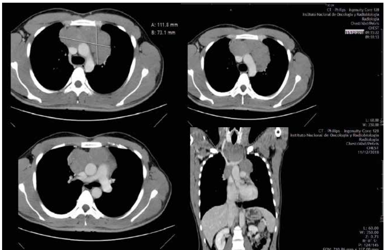
Figura 1. Paciente masculino de 43 años con Linfoma No Hodgkin tipo Burkitt. TC-Tórax contrastada IV corte axial y reconstrucción coronal, muestra conglomerado de ganglios supraclavicular (nivel I), y paratraqueales superior (nivel II), en ventana aorto pulmonar (nivel V) y paraórtico (nivel VI), formando una masa mediastinal de 111,8 mm localizada en el mediastino superior.

Las características morfológicas por Tomografía Computarizada en linfomas de localización mediastinal mostró ganglios con tamaño promedio de 25,1 \pm 17,3 mm con preponderancia de dimensiones que estuvieron entre los 12,0-25,9 mm ( n=28 ; 65,12%). En todos los niveles de la anatomía mediastínica se observaron lesiones ganglionares, a predominio del Mediastino Superior Derecho ( n=22 ; 51,16%) e Izquierdo ( n=17 ; 39,53%) respectivamente (Figura 1) (Tabla 3).